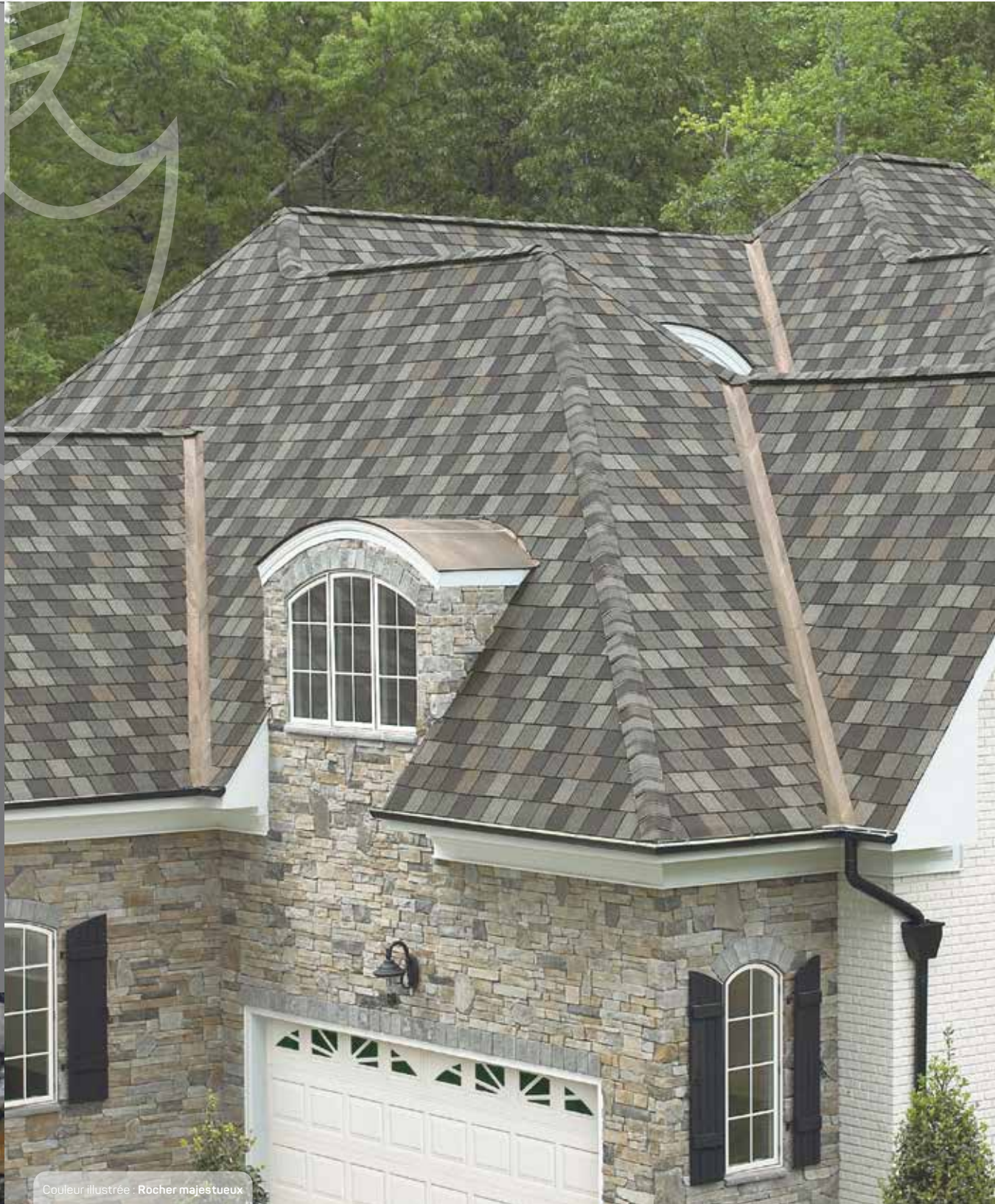
Couleur illustrée : Rocher majestueux