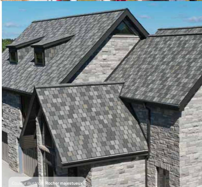
Couleur illustrée: Rocher majestueux

Chaque mélange de couleurs est une symphonie de teintes recréant les variations naturelles d'une ardoise de première qualité. Avec leur pureau grand format, ces bardeaux créeront sur votre toit un effet ardoisé percutant. De plus, leur prix abordable sera une douce musique à vos oreilles.